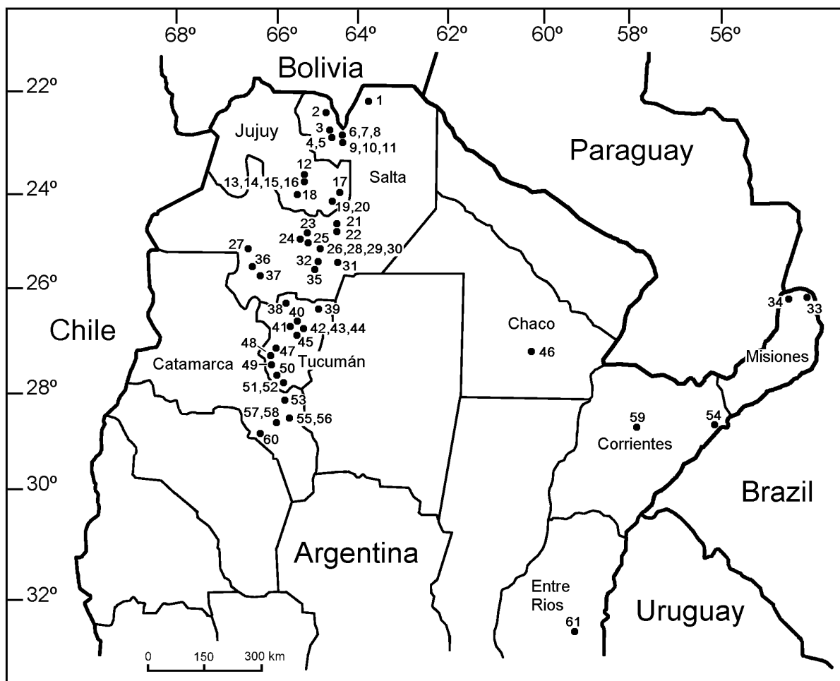
FIGURE 2. Map of northern Argentina showing the localities mentioned in text. All numbered localities are listed in the Appendix.

We also add new records for the Humid Chaco, Fields and Wedlands, and Pampas ecoregions that previously had few bat reports. For the others ecoregions, we add several occurrence points in areas with a small number of data. For example, we report many localities for the 25°S latitude in the Yungas forests. Forty three of the new localities presented here were not previously sampled.